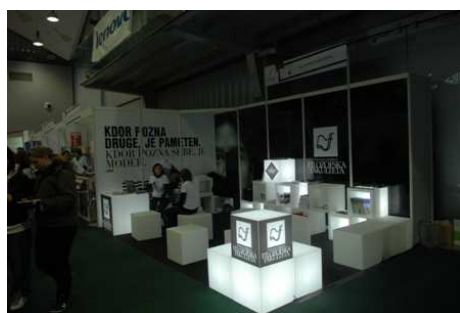
Stojnica FF na sejni Informativa 2010