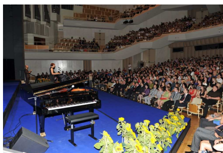
Podelitev diplom FF, junij 2010