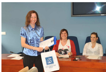
Podelitev priznanj visokošolskim učiteljem in sodelavcem