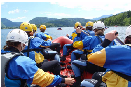
Rafting v Bohinju