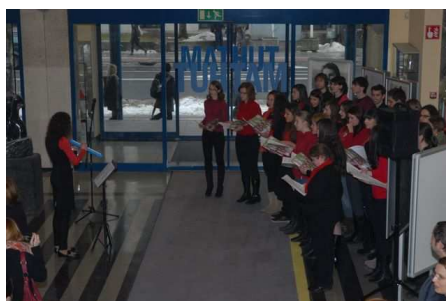
Nastop študentskega zbora FF v avli fakultete