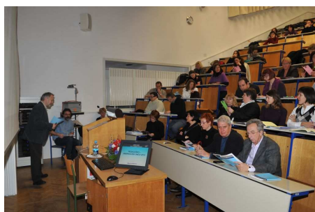
Pedagoško andragoški dnevi 2010