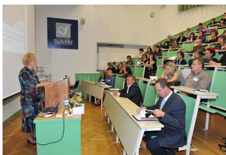
Otvoritev slavističnega kongresa