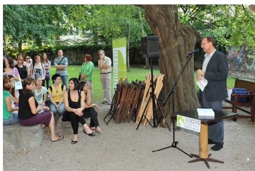
Podelitev potrdil tutorjem