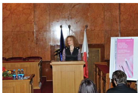
Otvoritev Simpozija Obdobja 2010