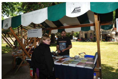
Sejem akademske knjige Liber.ac 2010