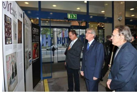
Otvoritev razstave češkega veleposlaništva v avli FF