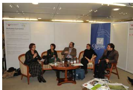
Debatna kavarna FF na Slovenskem knjižnem sejmu