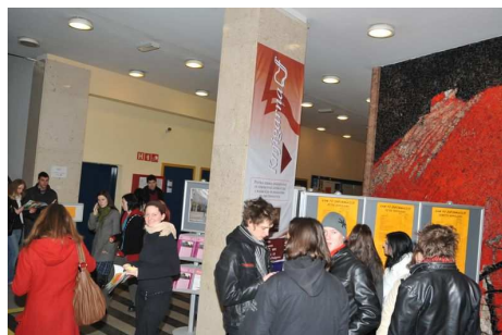
Informativni dan 2010