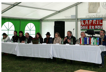
Utrinek z delavnice o medkulturnem dialogu