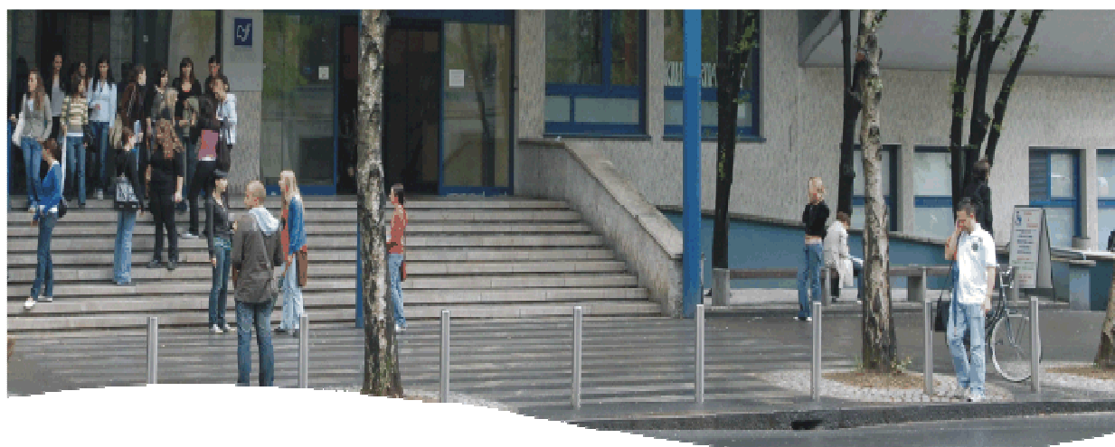
Stopnišče pred Filozofsko fakulteto