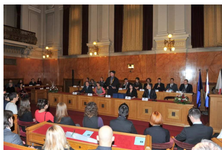
Podelitev Prešernovih nagrad študentom FF