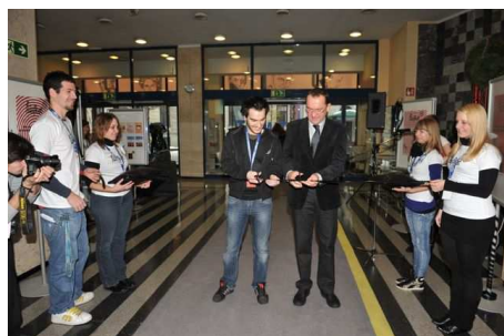
Otvoritev Filofesta 2010