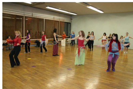
Tečaj orientalskega plesa študentk FF