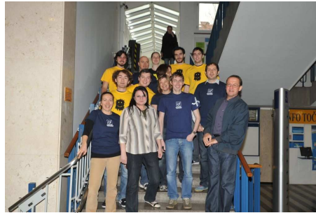
Študentski dnevi 2010