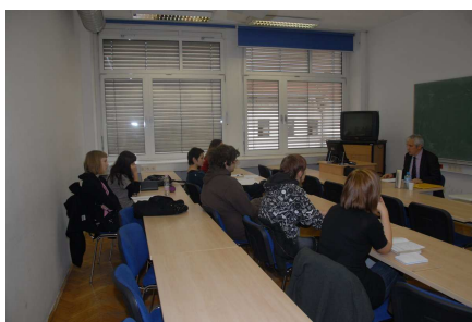
Predavalnica z 20 sedeži v 3 nadstropju