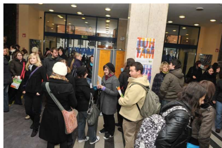
Informativni dan 2010