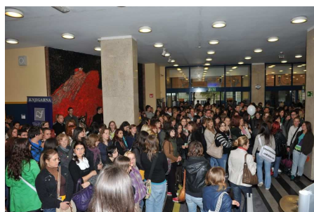
Sprejem brucev 2010