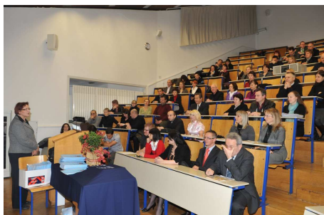
Predavalnica s 150 sedeži v pritličju fakultete

Strokovno podporo dejavnostim fakultete nudijo skupne strokovne službe in tajništva oddelkov .