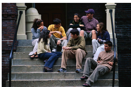
Študijska izmenjava Erasmus