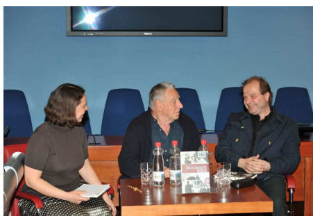
Utrinek z ene od Besednih postaj 2010